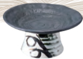
R281-310-07 桂川(黒)特高台6寸皿 φ19.5XH9.3cm ¥2,600