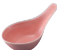
R281-293-74 深口レンゲPK 11.5X6XH5cm ¥480