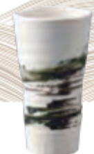
R282-310-14 山科(白)焼酎カップ φ8.4XH15cm-430cc ¥1,000