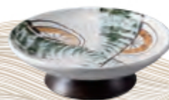
R282-310-10 花車高台7寸皿 φ21.3XH6.5cm ¥2,400