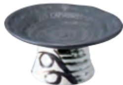
R281-310-06 桂川(黒)特高台5寸皿 φ16.5XH8.8cm ¥2,100