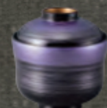
R282-290-9809 まゆ粉吸椀(パール) 身8.9XH6.8cm ¥2,650