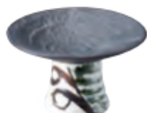
R281-310-05 桂川(黒)特高台4寸皿 φ14XH7.8cm ¥1,500