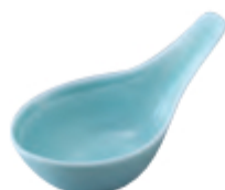
R281-293-72 深口レンゲBL 11.5X6XH5cm ¥480