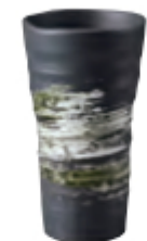
R282-310-15 山科(黒)焼酎カップ φ8.4XH15cm-430cc ¥1,000