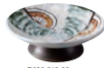
R282-310-09 花車高台6寸皿 φ18.8XH6.2cm ¥1,900