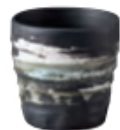
R282-310-13 山科(黒)マルチカップ φ9.2XH9cm-380cc ¥900