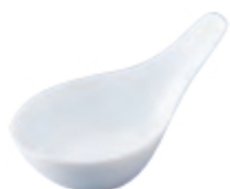
R281-293-71 深口レンゲWH 11.5X6XH5cm ¥480