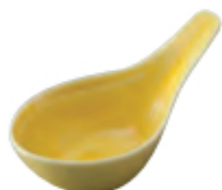
R281-293-73 深口レンゲYE 11.5X6XH5cm ¥480