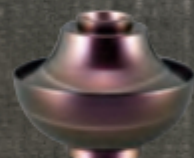
R282-290-9811 長寿椀 華秀(茶) 身φ10.7XH5.3cm ¥5,800