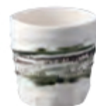
R282-310-12 山科(白)マルチカップ φ9.2XH9cm-380cc ¥900